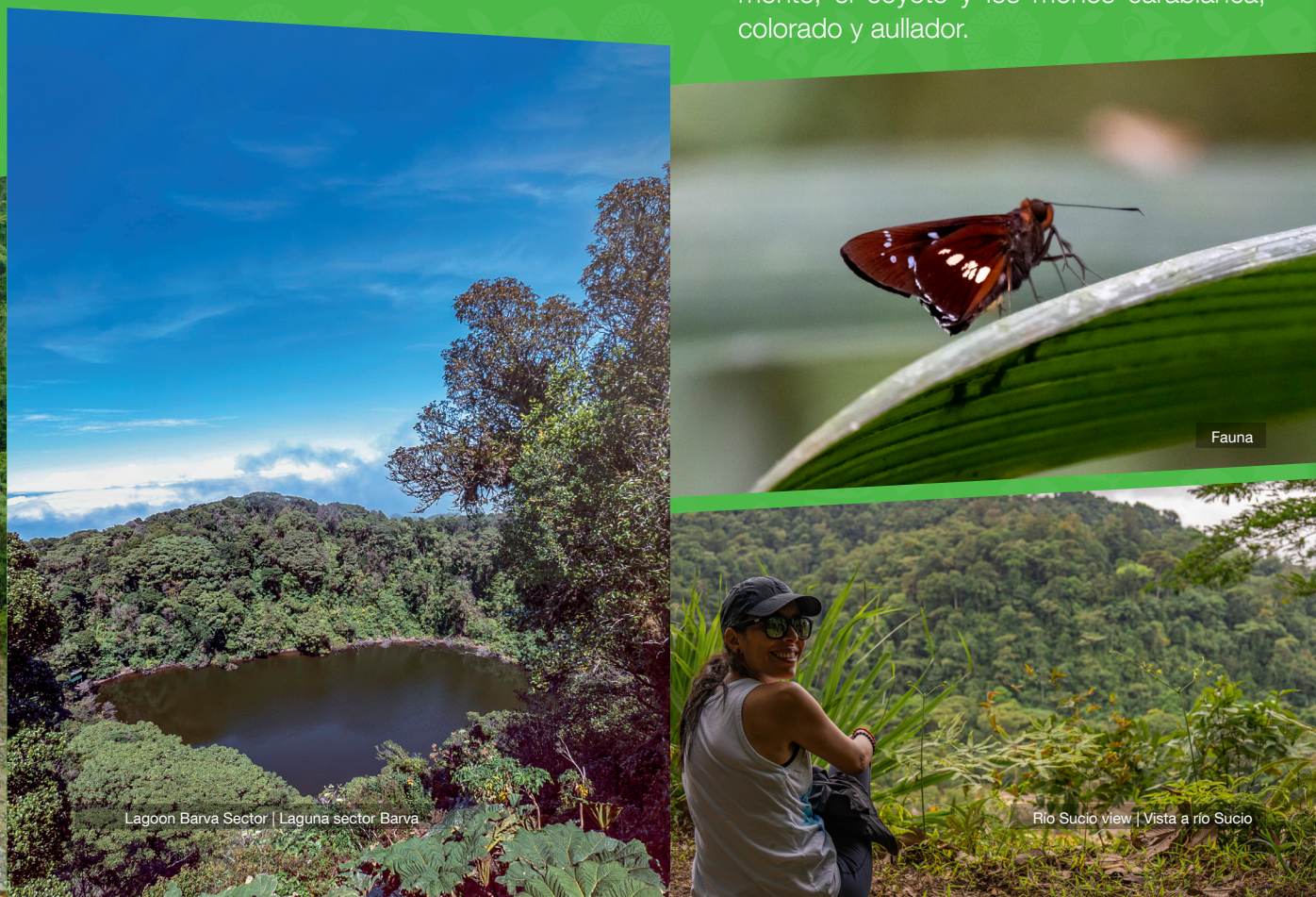
Lagoon Barva Sector | Laguna sector Barva