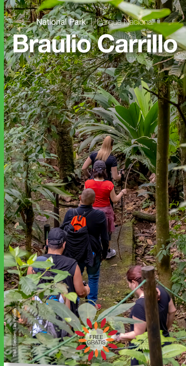
Trail | Sendero Las Palmas