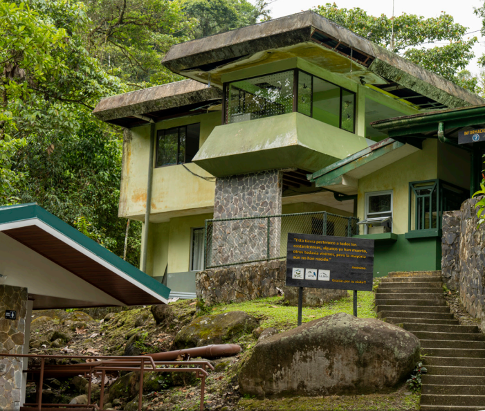
Sector Quebrada González Entrance | Entrada