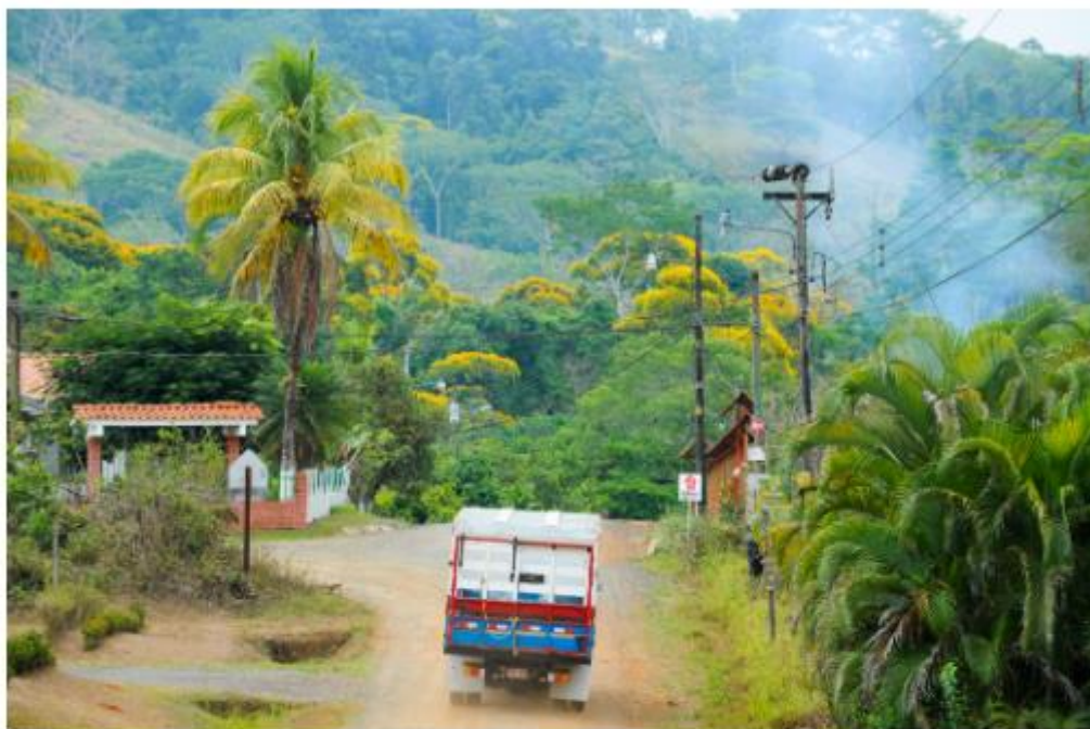
Le parc national Carara, l'une des merveilles du Costa Rica

Rassurez-vous : il est encore possible de parcourir le Costa Rica en évitant les itinéraires les plus touristiques, tout en goûtant pleinement à la beauté, la biodiversité et l'authenticité du pays ! Si vous avez déjà vu les grands classiques de ce petit paradis d'Amérique centrale, voici un itinéraire qui prend son temps, au départ de San José, en passant par les Hautes Terres Centrales jusqu'aux rivages du Pacifique Central, avant de revenir vers le parc national Carara.