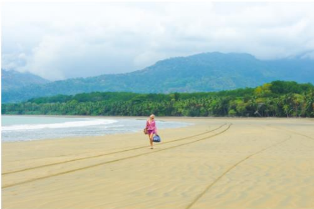
Balade sur le tombolo de Playa Uvita

Changement radical d'ambiance en piquant vers la côte Pacifique, et plus précisément le parc national Marino Ballena , premier parc marin du Costa Rica, créé en 1989. Moins connu que le Parc Manuel Antonio, on y est plus tranquille, et la faune n'est ici pas menacée par la surfréquentation et la pollution. On y vient pour observer les baleines à bosse venant d'Amérique du Sud (entre juillet et octobre), tandis que celles provenant du nord montrent le bout de leur queues entre décembre et avril. Les dauphins tursiops, eux, sont là toute l'année. Les récifs du parc hébergent 18 espèces de corail, qu'on peut admirer en snorkeling, et les 15 km de plages, immenses, sont très agréables à parcourir à pied, surtout le tombolo de playa Uvita, en forme de... queue de baleine ! On trouve des spots de surf renommés à Playa Hermosa et Dominical. Les forêts bordant le littoral regorgent de singes hurleurs, d'aras et d'iguanes.