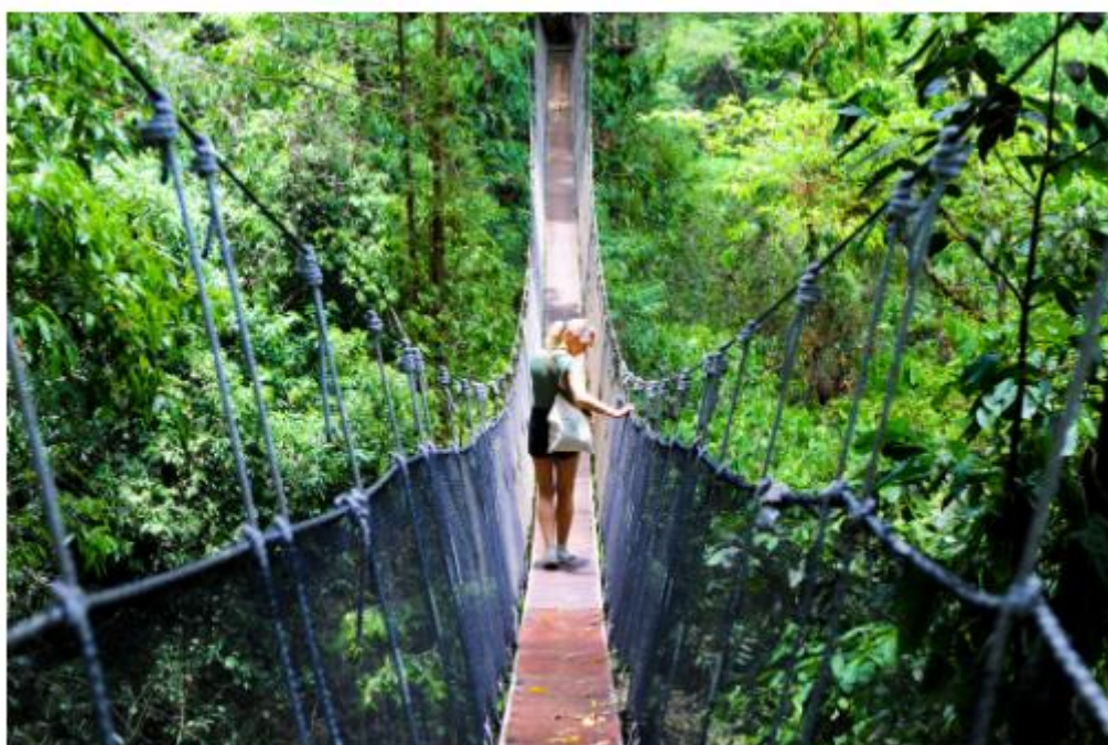
Peu connue, la réserve privée de Rainmaker s'étend sur 600 hectares

Vous avez assez pris de coups de soleil comme ça ? On repart donc dans cette magique forêt primaire pour y retrouver un peu d'ombre, et une biodiversité hors du commun. Peu connue, la réserve privée de Rainmaker s'étend sur 600 hectares, et s'y promener est un véritable enchantement. Ici aussi, vous serez quasiment seuls, les aménagements sont réduits au strict minimum ; en 2 heures vous bouclez une randonnée vous faisant passer par d'excitants ponts suspendus au-dessus de la canopée, et des cascades au pied desquelles il est possible de se baigner. En étant attentifs, vous verrez les incroyables grenouilles dendrobates aux sécrétions dermiques toxiques, ou les basilics (des surprenants reptiles capables de courir sur l'eau).