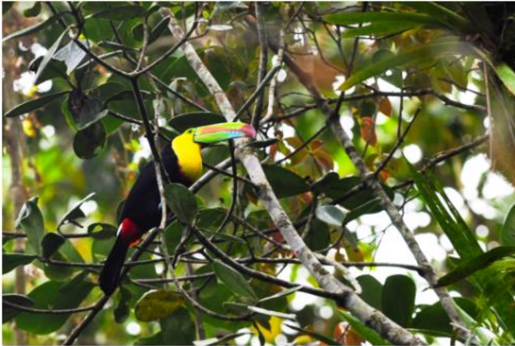
Pendant votre promenade, levez bien la tête ! Vous pourriez vous faire des amis !

On pénètre ensuite la forêt pour visiter les ruines du monument national Guayabo , site précolombien le plus important du pays. Loin des foules de touristes, on arpente tranquillement ces lieux mystérieux, habités de 1500 av. JC à 1400 apr. JC, et abandonnés pour des raisons inconnues. Au milieu des tertres, pétroglyphes, et autres aqueducs de pierre, on peut observer toucans ou paresseux.