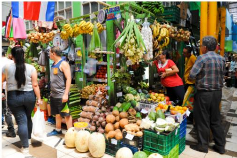
Pause au Mercado Central, principal marché de la capitale

Pour prendre le pouls de la ville, empruntez l'Avenida 2, faites une pause au Parque Central et dans la cathédrale, sur la Plaza de la Cultura, ou encore au Mercado Central, principal et très typique marché de la capitale . Flânez dans le Barrio Amón, quartier Belle Epoque plein de demeures coloniales transformées en galeries d'art, concept stores ou cafés.