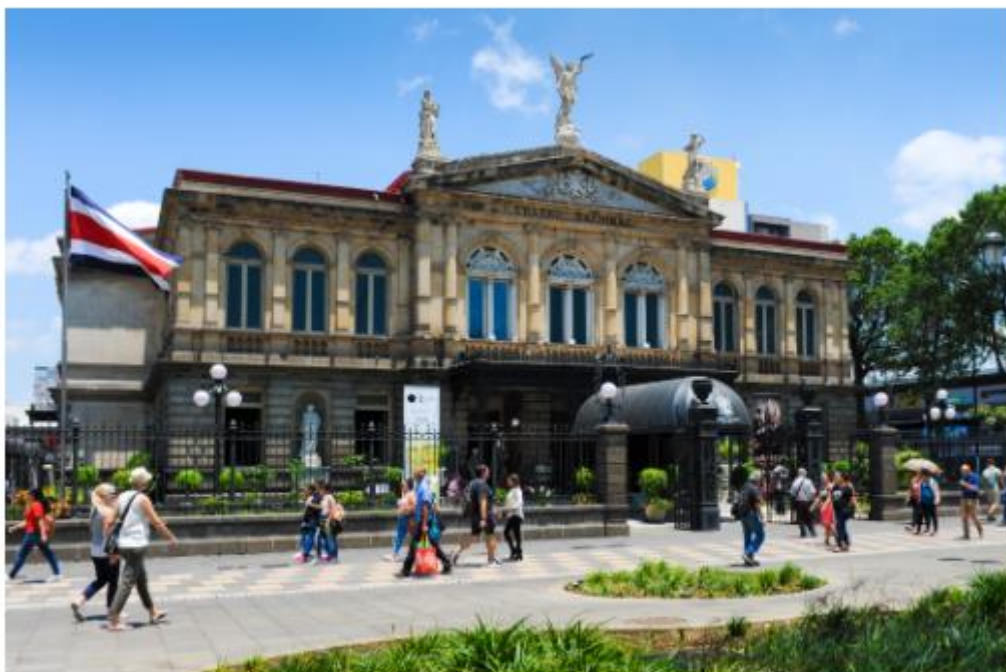
Le Teatro Nacional, un joyau d'architecture bâti en 1890, est célèbre pour sa ressemblance avec l'Opéra Garnier de Paris.

La plupart des voyageurs n'ont de San José qu'un très bref aperçu à travers la vitre du taxi ou du bus qui les mènent de l'aéroport à leur hôtel. Pourtant, même si l'on vient au Costa Rica pour les innombrables attraits de sa faune et de sa flore , il serait vraiment dommage de passer à côté des trésors culturels de cette ville attachante, fondée en 1737 et concentrant environ 30% de la population. A commencer par le Teatro Nacional, un joyau d'architecture bâti en 1890, célèbre pour ses fresques, son intérieur néo-baroque, et sa ressemblance avec l'Opéra Garnier de Paris. Parmi les nombreux excellents musées qu'abrite San José, ne manquez surtout pas le fascinant Musée de l'Or Précolombien (un des plus importants d'Amérique latine, qui donne à voir 1600 objets et ornements), ainsi que le Musée du Jade et de la Culture Précolombienne, situé dans un étonnant bâtiment cubique, qui expose la plus fameuse collection de jade précolombien au monde.