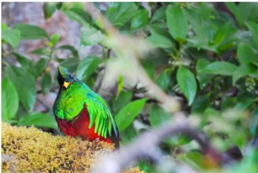
Le quetzal est l'un des plus beaux et rares oiseaux tropicaux du monde !

En piquant vers le sud, vous traversez Cartago, ancienne capitale du Costa Rica , connue pour sa basilique Notre-Dame des Anges - la plus importante église du Costa Rica, faisant figure de Lourdes locale, où l'on mesure pleinement la ferveur catholique des costariciens. Puis on se retrouve à serpenter dans le luxuriant canyon de la vallée d'Orosi, entre rivières impétueuses, plantations de caféiers, cascades et vierges forêts de nuages. Voilà enfin San Gerardo de Dota, vallée bucolique et encaissée qui attire les fanas d'ornithologie, car c'est ici que l'on a le plus de chance d'apercevoir, entre avril et mai, le mythique quetzal , l'un des plus beaux et rares oiseaux tropicaux qui soient. Pour profiter pleinement de cette ambiance de bout du monde où les visiteurs se font discrets, dormez au fantastique Dantica Cloud Forest Lodge , avant de vous offrir une randonnée, à pied ou à cheval, dans des paysages dignes du Seigneur des Anneaux.