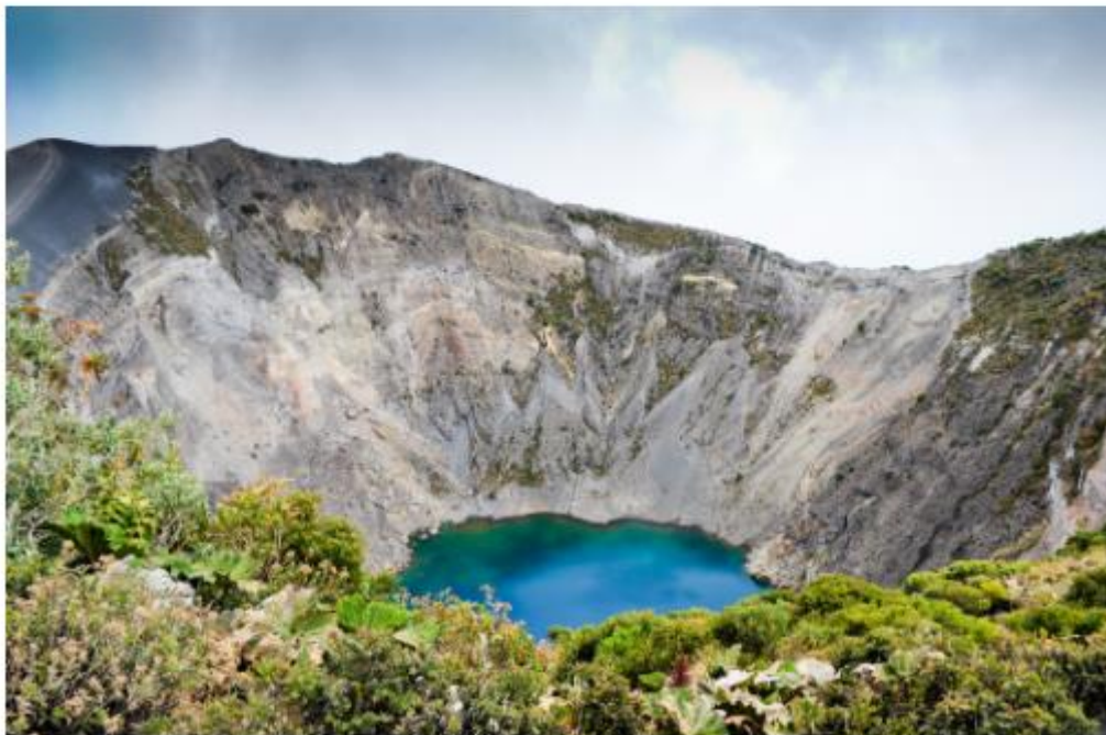
Le volcan Irazu est le plus haut et le plus actif du pays, il culmine à 3432m d'altitude !

Depuis San José, cap à l'est vers les Hautes Terres Centrales, domaine des volcans sillonné par de très belles routes bucoliques. On perd ses repères en roulant parmi de fertiles pâturages cernés de fermes et de plantations, de forêts de pins et de cèdres, se croyant parfois en Suisse tant ce vert paysage de montagne au microclimat tempéré surprend sous ces latitudes. Il faut même parfois slalomer entre les vaches qui musardent sur le bitume... Si Arenal est le volcan le plus visité du pays, Irazu est lui le plus haut et le plus actif historiquement ! Culminant à 3432m d'altitude, il surgit soudain dans ce tableau champêtre, entouré d'un parc national de 18km 2 , et on peut observer le lac bleu-vert au centre de son cratère depuis une plate-forme aisément accessible.