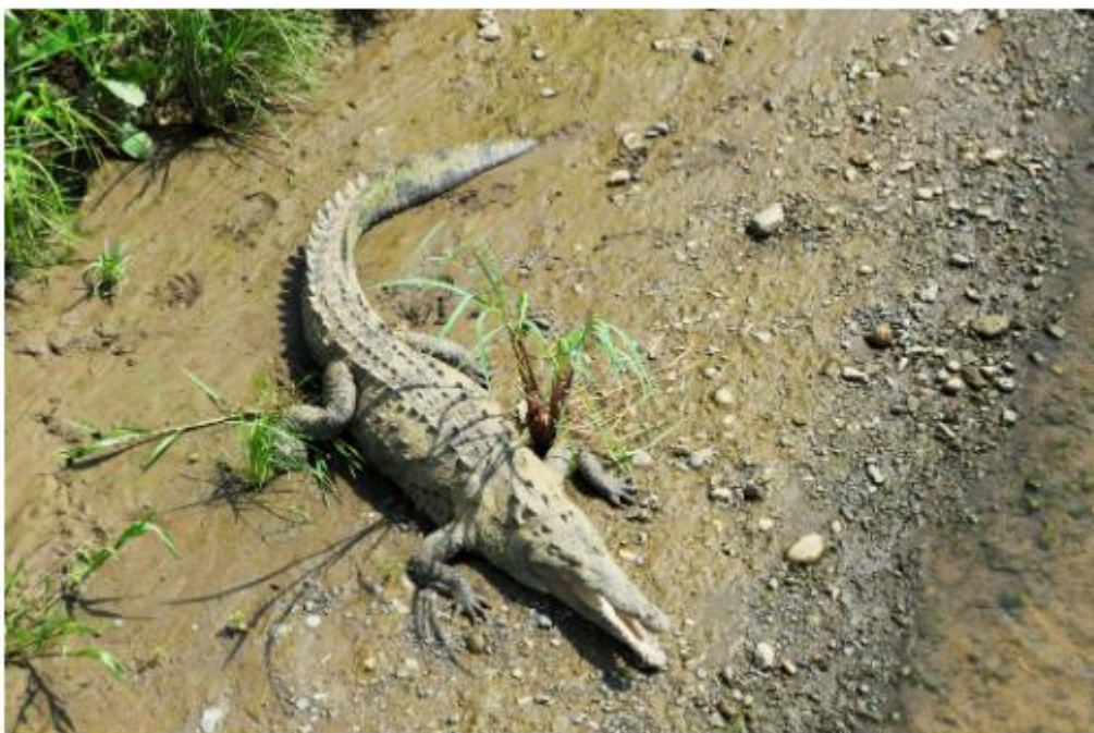
Crocodile dans le Rio Tarcolès

Avant de rejoindre le Rio Tarcoles pour observer les crocodiles américains (ils peuvent atteindre 7m de longueur!) dans l'arrière-pays, offrez-vous une nuit de rêve au joli Macaw Lodge . Après une demi-heure de piste - 4x4 conseillé! -, vous rejoignez cet éco-lodge perdu en pleine forêt dans le périmètre du parc national Carara , dont votre chambre n'est séparée que par une moustiquaire... Immersion radicale en pleine nature assurée, avec concert polyphonique des singes, oiseaux et batraciens la nuit, petits plats bio tout droits sortis du potager, sessions de yoga et balades super zen pour déconnecter à coup sûr !