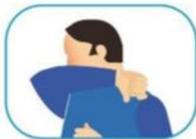
4 Protocolo de estornudo y tos