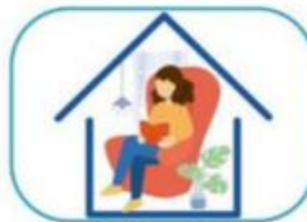
6 Quedate en casa