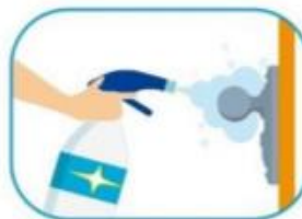
3 Limpiar las superficies de alto contacto