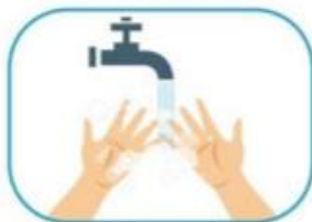
1 Lavado de manos