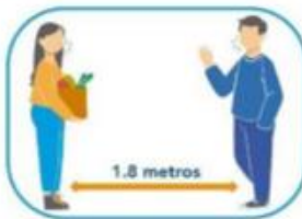
5 Distanciamiento social