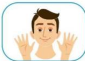
2 No se toque la cara si no se ha lavado las manos