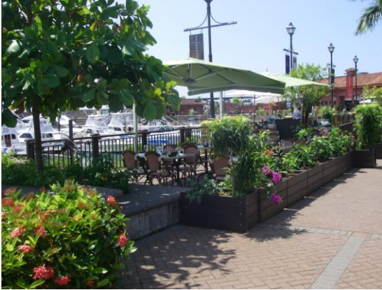
Área comercial y senderos peatonales de Marina Los Sueños

y atracaderos turísticos por parte de la Unidad Técnica de la CIMAT coadyuvando con el resguardo del medio ambiente y los recursos naturales de las zonas costeras.