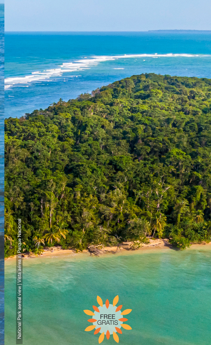
National Park aerial view | Vista aérea al Parque Nacional