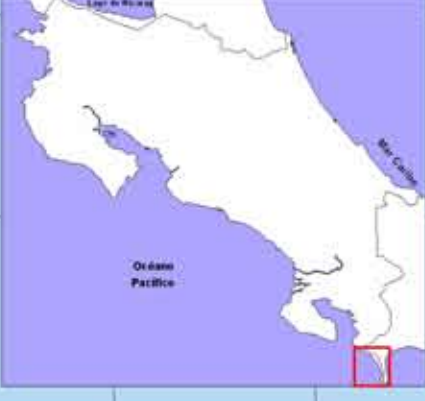
Diagrama de Referencia