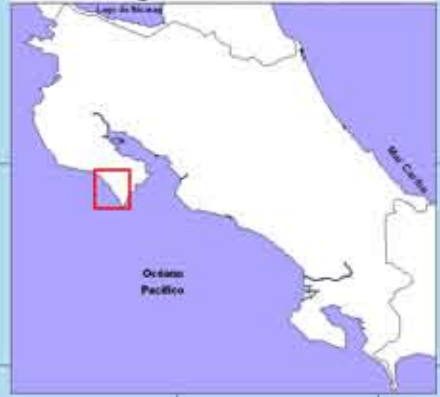
Diagrama de Referencia