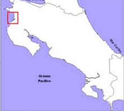
Diagrama de Referencia